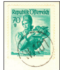
Postamt Wien 101

Sollte ein solches Stück auch beim Zustellpostamt übersehen worden sein, wäre es Pflicht des Briefträgers eine Nachentwertung vorzunehmen. Nicht jeder hat jedoch den stummen Stempel bei sich, also kommt es vor, dass man auch kreuz und quer mit Kugelschreiber durchgestrichene Briefmarken vorfindet. Das ist zwar nicht schön, entspricht aber den Postvorschriften.