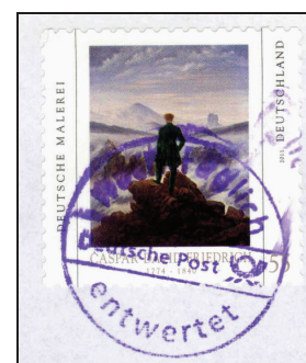
Nachentwertung in Deutschland