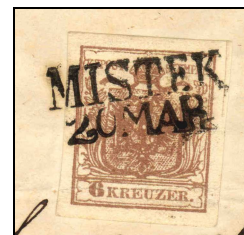
Orts- und Datumsstempel Mistek (Böhmen) 20. März 1858

Vor einiger Zeit haben wir beim Jugendtreff darüber geredet, wie wenig die verschiedenen Poststempel im Vergleich zu den Postwertzeichen eigentlich beachtet werden. Dabei hat es schon lange Stempel gegeben, ehe die Briefmarken aufkamen. Zur genauen Begriffsbestimmung sei festgestellt, dass ein Stempel von einer berechtigten Person mit einer entsprechenden Vorrichtung auf dem Poststück aufgedruckt wird. Dieser Stempel kann sehr unterschiedlich aussehen, weist derzeit aber meistens Ort, Datum und Uhrzeit auf.