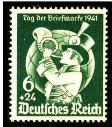
Deutsches Reich 1941 (erste Marke zum TdB)