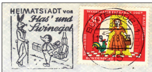
Deutschland: Stempel ist für etliche Motive geeignet