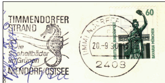
Deutschland: Motiv Seepferdchen

Voriges Mal haben wir über die Ortstagesstempel gesprochen. Inzwischen ist uns aber aufgefallen, dass es Stempel gibt, die solche Tagesstempel mit Reklame-Bildern und/oder Texten kombinieren. Manche Sammler sprechen von „Ortswerbestempel“. Da jedoch auch oft Propaganda für sonstige Gelegenheiten gemacht wird, die nicht unbedingt mit einem Ort zusammen hängen, wollen wir lieber das Wort „Werbestempel“ verwenden.