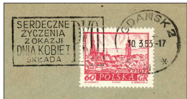
Polen: Die Sparkasse sendet Glückwünsche