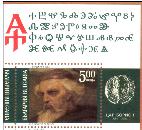
Ländersammlung Bulgarien Thema Geschichte des Balkans Thema Kyrill und Method Thema Fremde Schriften

Hier nochmals etliche Beispiele, und die Anwendungsmöglichkeiten: