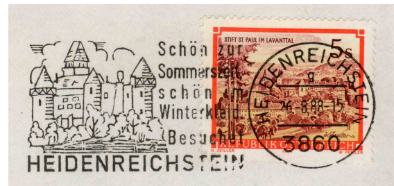
Ländersammlung Österreich Thema Burgen Heimatsammlung Waldviertel Spezialsammlung Werbestempel