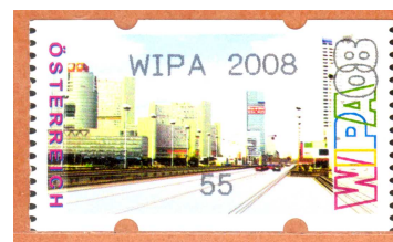
Ländersammlung Österreich Thema Wien Spezialsammlung Automatenmarken Heimatsammlung Wien